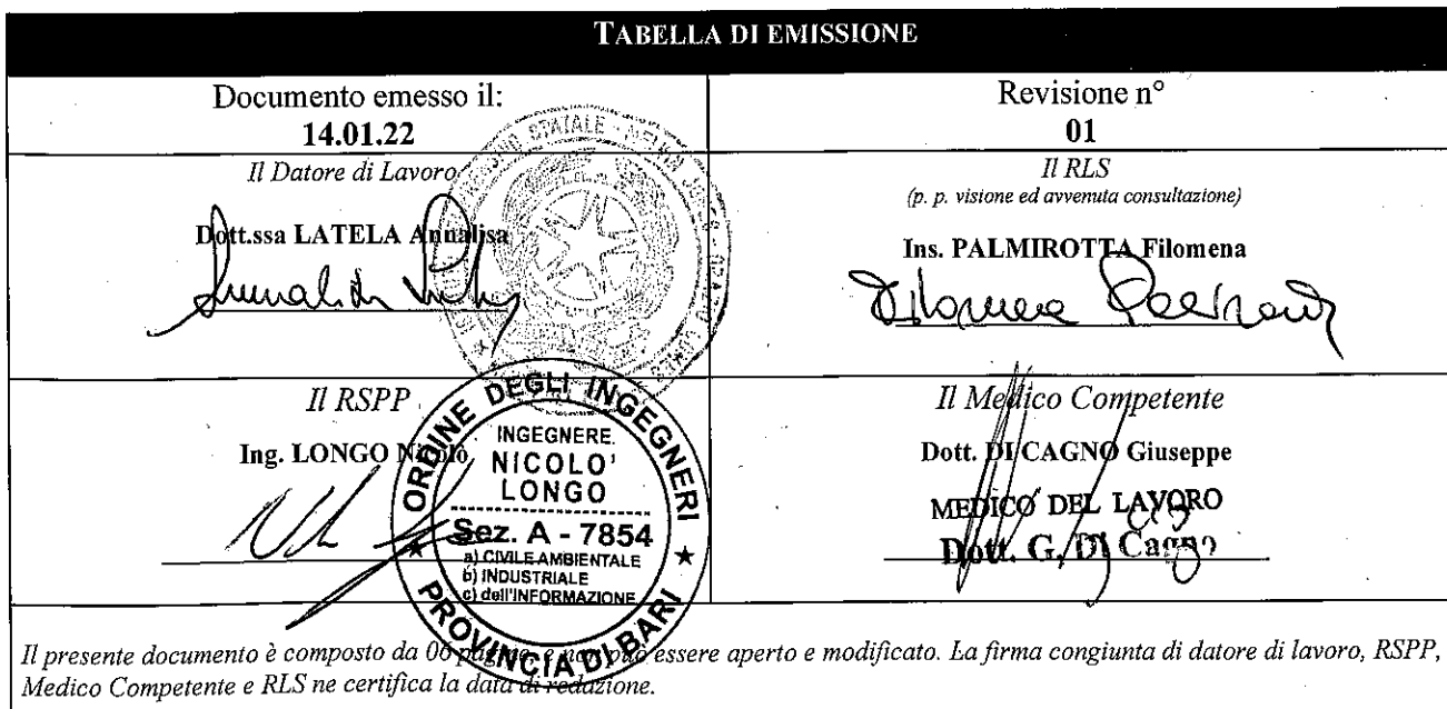
TABELLA DI EMISSIONE